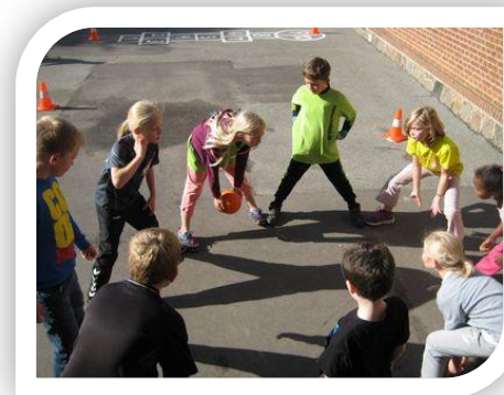
Frikvarter på Korning Skole

Her findes både skole, daginstitution og dagpleje – og et mangfoldigt foreningsliv. Vi har overkommelige huspriser og billige byggegrunde.